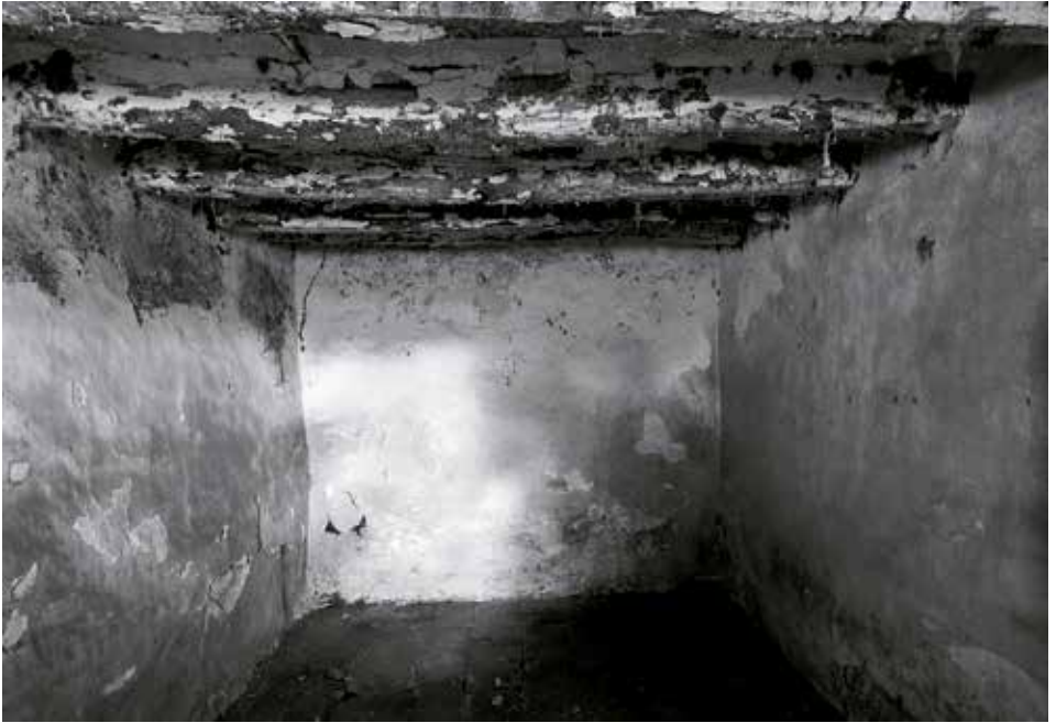
"Interior I" 2015

Joan Forteza www.joanforteza.wix.com/fotograf