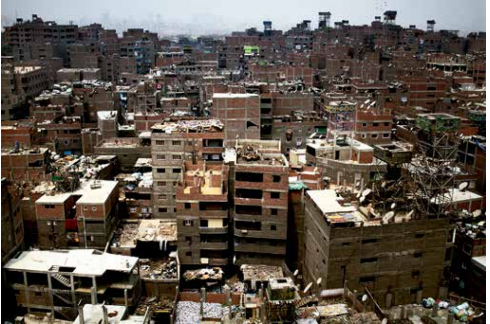
Manshiyat Naser, Cairo, Egipto, Abril de 2014.