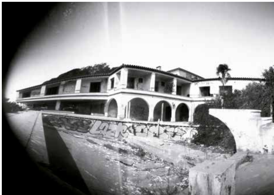
"Hotel Biarritz N-340" año 2015