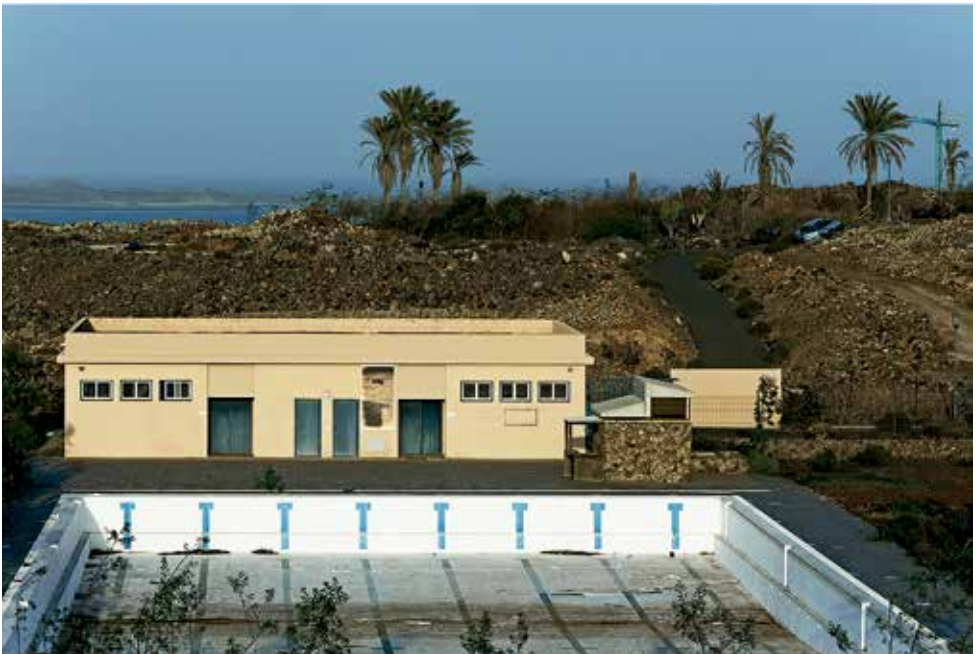
Piscina Municipal, serie Naturaleza Difusa. Corralejo, Fuerteventura. 2010

La problemática generada a raíz de la antropización desmesurada son los motores de mi trabajo personal, creando en mí una obsesión y una necesidad en poner de manifiesto la fotografía como medio conservacionista de los espacios en situación de abandono.