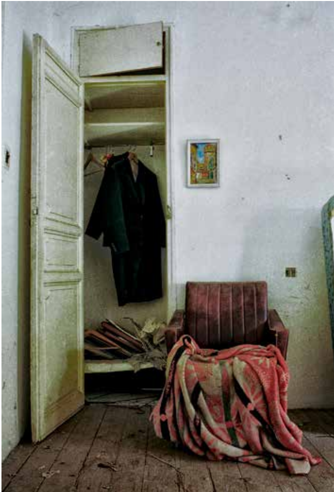
Casa Rota, Segovia 1999

Juan C. Gargiulo www.jgargiuloblanco.wix.com/jcgargiulophoto